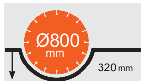
ADANCIME MAX. TAIERE